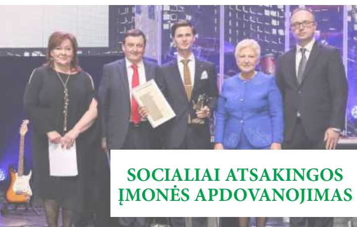
SOCIALIAI ATSAKINGOS ĮMONĖS APDOVANOJIMAS

Esame įsitikinę, kad atsakingas lobizmas yra svarbus ir teisėtas būdas dalyvauti politinių sprendimų priėmimo procesuose. Mes dalijamės ekspertine patirtimi ir informuojame apie savo indėlį įgyvendinant politinius sprendimus, susijusius su mūsų, verslo bendruomenės, veikla. Tikime, kad verslo ir visuomenės iššūkius geriausia spręsti tik susitelkus visoms suinteresuotoms šalims. Atsakingas lobizmas taip pat apibrėžtas ir asociacijos etikos kodekse .