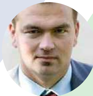
Mykolas Katkus Fabula | Hill + Knowlton